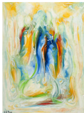
"Delicatezza" Tecnica mista su tela 60X80