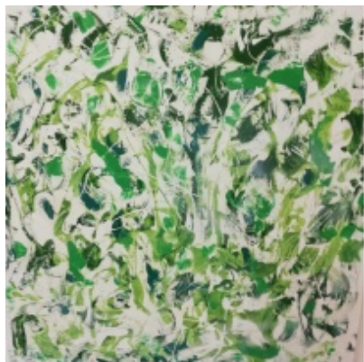
"Monocromatismo gioioso" Tecnica mista su tela 100X100